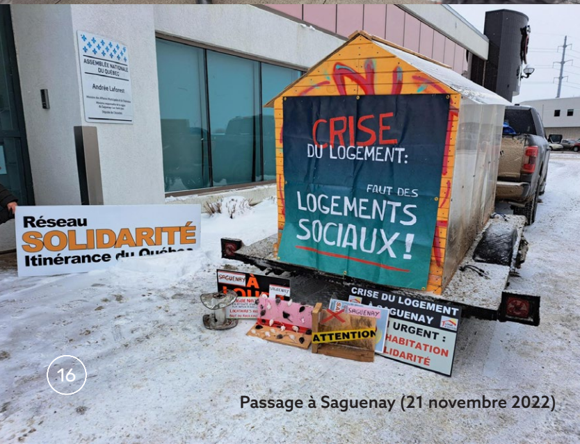
Passage à Saguenay (21 novembre 2022)

Le RSIQ a joint sa voix au FRAPRU en mentionnant qu'en « raison du manque criant de logement social, les organismes en itinérance sont actuellement au maximum de leur capacité puisqu'il est presque impossible de trouver un logement aux personnes qu'elles accompagnent. » Extrait de l'allocution du RSIQ à la manifestation du 14 février 2023 à Québec.