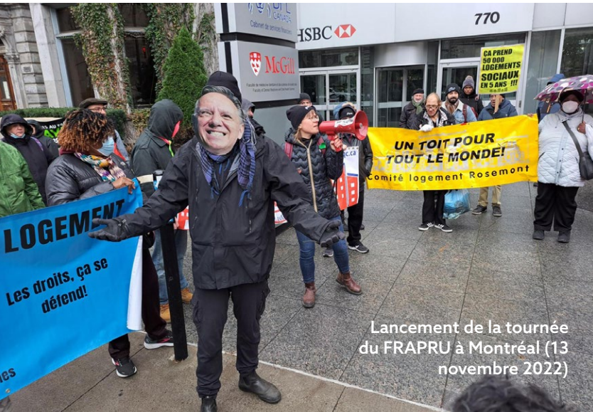
Lancement de la tournée du FRAPRU à Montréal (13 novembre 2022)