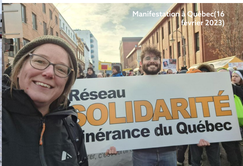
Manifestation à Québec (16 février 2023)